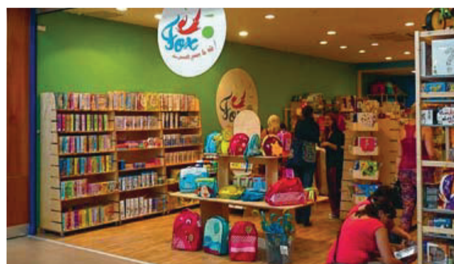
Déjà cinq commerces ouverts.